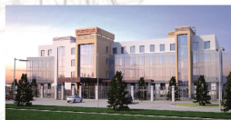
Центральная станция скорой железнодорожной помощи (Астана)