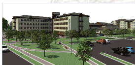
Макрорегиональный профессиональный центр по подготовке кадров (Сибирьтау)

«ASTANA-PROJECT» реализовано более 50 проектов по направлениям: территориальное планирование, моделирование, прогнозирование, проектирование зданий и сооружений, инжиниринг в строительстве