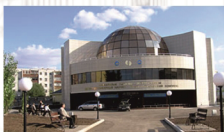
Здание междисциплинарного научно-исследовательского комплекса (Астана)